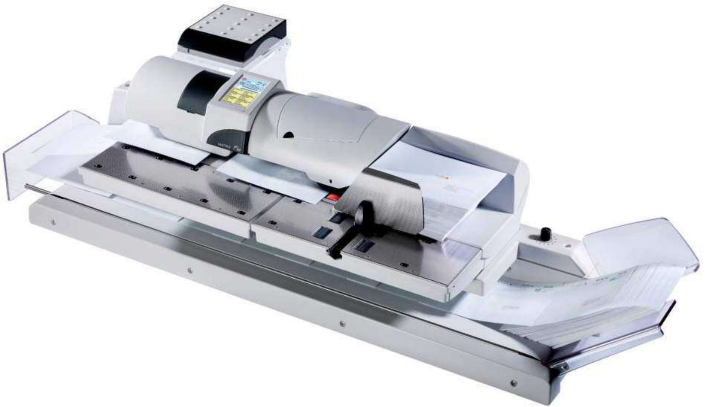
Schuppenablage CF6 inkl. Frankiersystem Matrix F82, Waage und Acrylständer