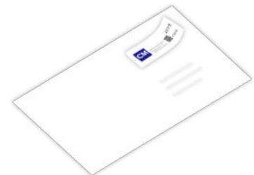
Frankatur drucken & aufkleben