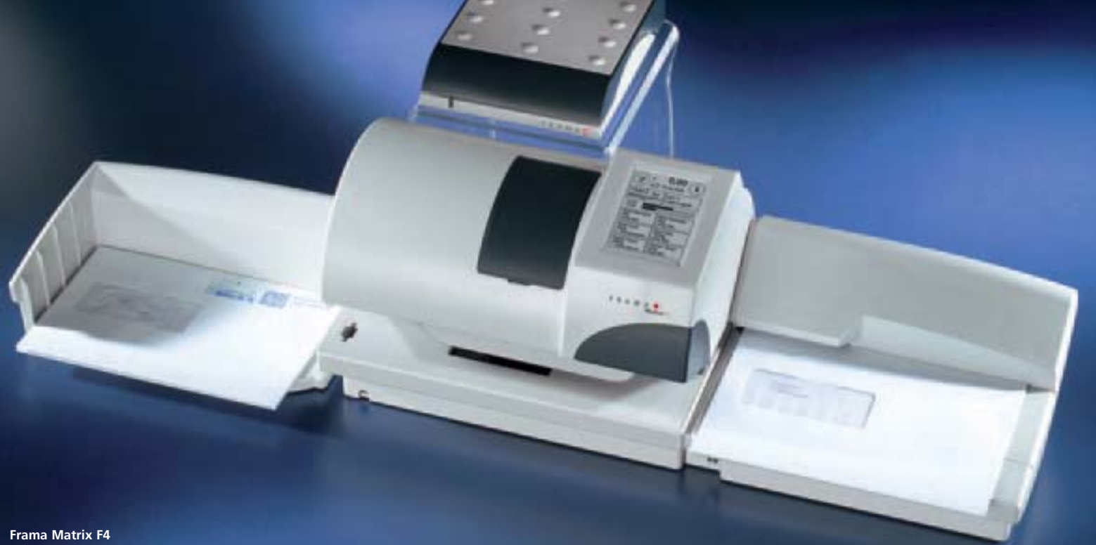
Frama Matrix F4