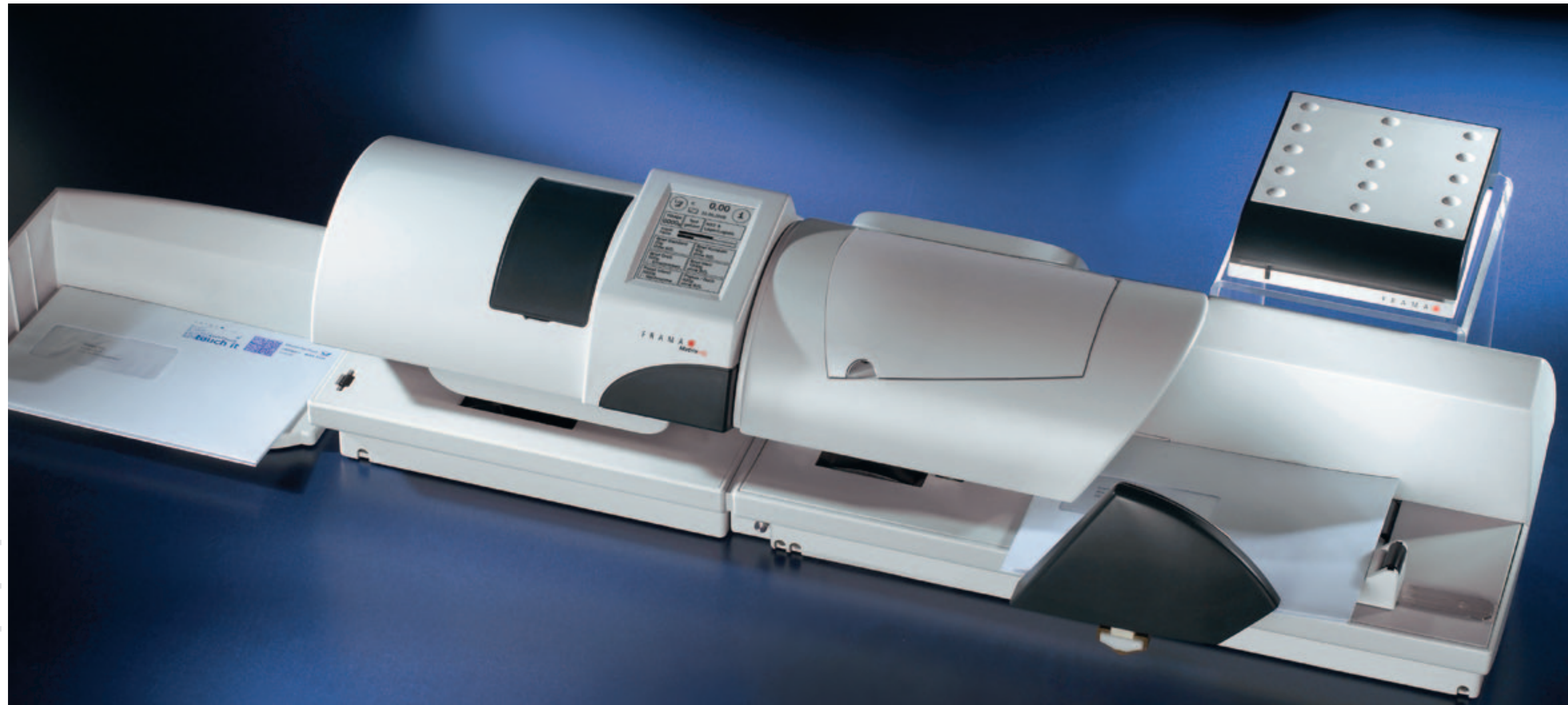
Frama Matrix F6