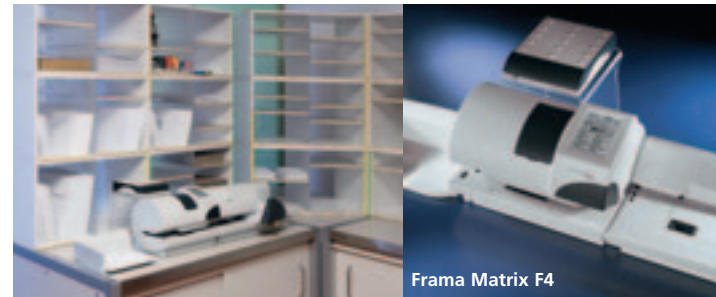
Frama Matrix F4

Mittlere und größere Unternehmen haben heute ganz neue Anforderungen an ihre Frankiersysteme. Deshalb kommen die neuen Modelle Frama Matrix F4 und F6 goldrichtig. Sie begeistern durch einfachste Bedienung, eine einmalig hohe Druckqualität und kundengerechte Dienstleistungen.